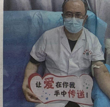
无偿献血,奉献爱心。

6月14日是世界献血者日。6月10日上午,惠民县胡集镇卫生院组织医护人员,开展无偿献血活动。 该院医护人员认真填写登记表,配合工作人员进行初筛检测、采血。符合献血条件的职工依次进入献血区,有序进行献血,充分展现了该院医护人员无私奉献的精神风貌。